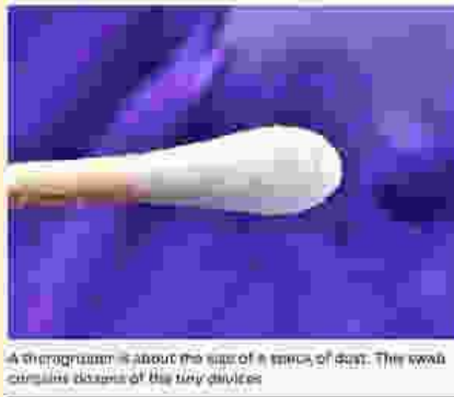
Afb. 2: Theragrippers op een wattenstaafje

Opmerking: Volgens Johns Hopkins University, de Theragrippers worden eigenlijk toegediend met een wattenstaafje. (zie fig. 2 )